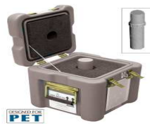
Système de transport compact spécifique pour le PET