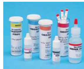
Test chromatographique du Technetium ^{99m}\text{Tc} PAPIER ITLCSG