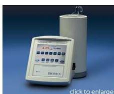
Dispositif de calibration