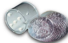
Hoffman 3D Brain