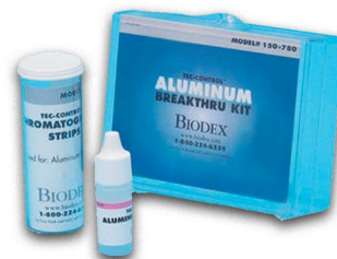
Kit de contrôle de la concentration aluminium dans l'éluat technétié