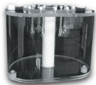
PET NEMA 2012/IEC 2008