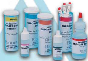
Whatman 31ET, 1 et 17 Gel de Silice, Acide Silicique